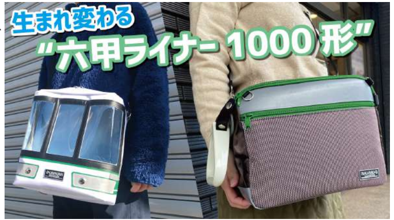
▲六甲ライナー 1000 形ショルダーバッグ（左） | 六甲ライナー 1000 形ボックスショルダーバッグ（右）

サンワードでは、他にも自社の縫製技術を活かした SDGs に特化したファクトリーブランドを多数展開しております。