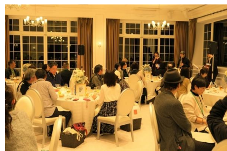
「ラヴィマーナ神戸」にて ジャズ生演奏を聴きながらディナーを堪能

公式サイトでの予約フォームより、氏名、電話番号、参加人数等を入力の上、お申し込み