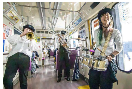
ポートライナーの車内でのジャズの生演奏